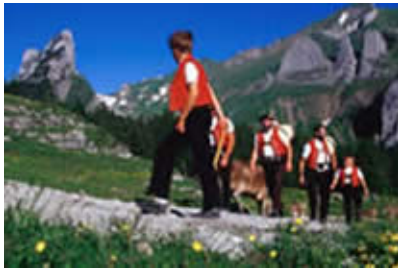
Alpaufzug im Alpstein